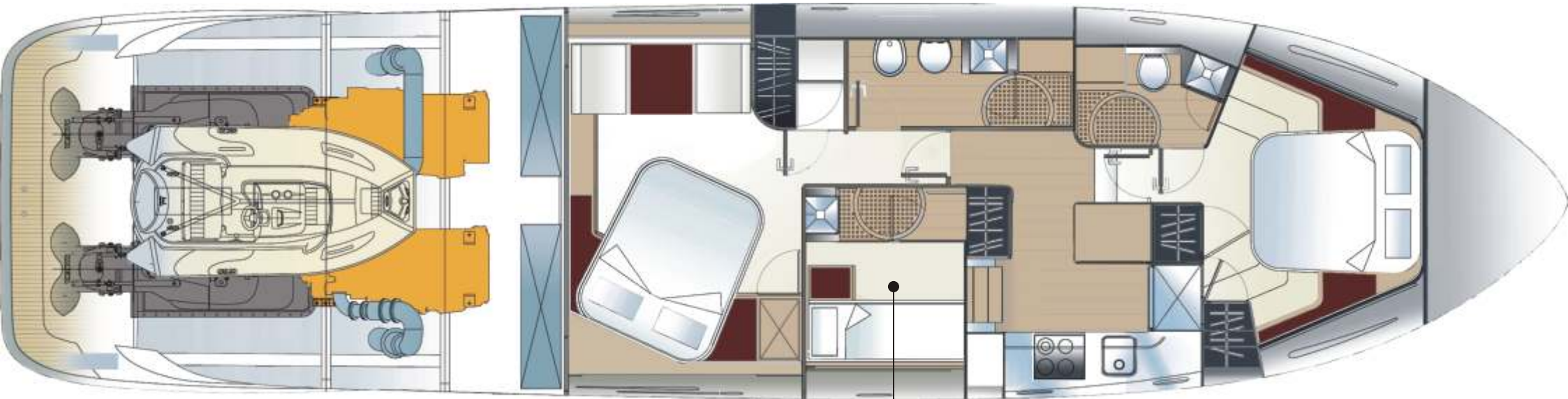
Optional Crew cabin, with the entrance from the galley